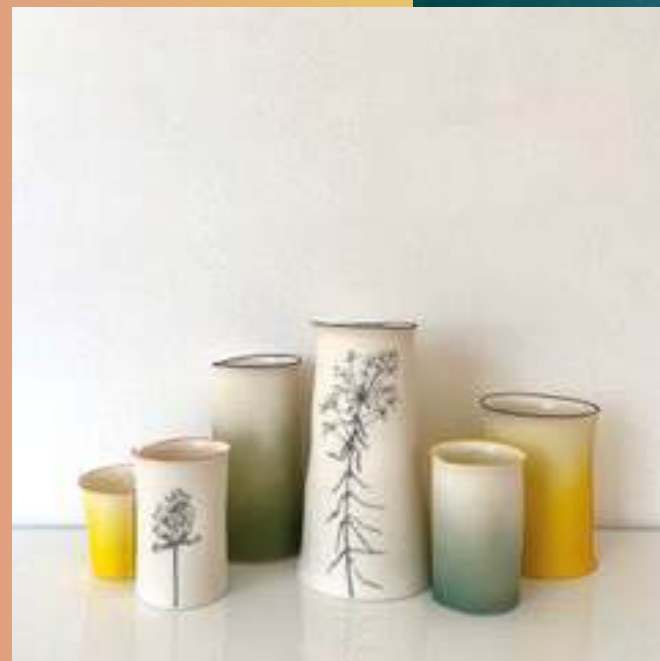
Utilitaire, Arts décoratifs, Porcelaine

86000 Poitiers 06 52 11 13 37 delphiniez@gmail.com www.delphiniez.com @delphiniez