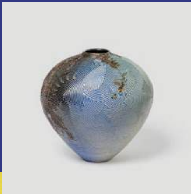
Arts décoratifs, Gres blanc tourné, gravure, email

45500 Gien 07 71 64 71 66 gregoire.lemaire01@gmail.com www.instagram.com/gregoire.lemaire/ @gregoire.lemaire