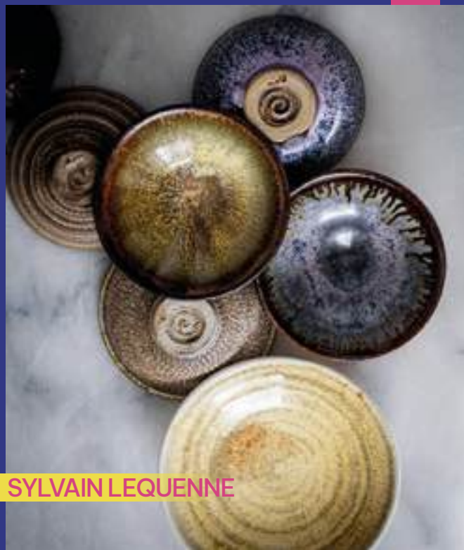
Utilitaire, terres repoussées, émaux, grès

29550 Plomodiern 06 67 84 97 72 sylvain.lequenne@gmail.com /// @atelier_amphotere