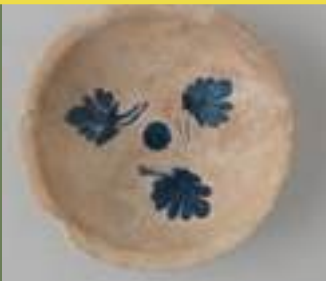
Bol bleu et blanc (Mésopotamie) Faïence peinte en bleu sur un émail blanc opaque (étain). Nishapur, Iran, IX e /X e siècle Crédit Rogers Fund, 1939

Un tournant majeur a lieu entre le IX e et le XIII e siècle dans le monde islamique. Les potiers de Perse et de Mésopotamie perfectionnent l'usage du cobalt et créent des glaçures blanches opaques à l'étain, offrant un fond idéal pour le décor peint en bleu. Le cobalt devient un pigment essentiel, apprécié pour sa stabilité à la cuisson et l'intensité de sa couleur.