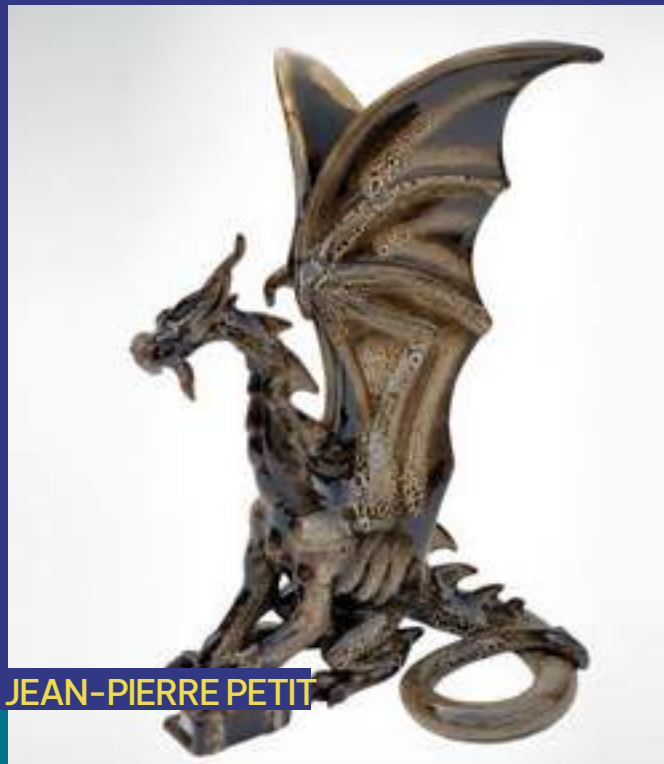
Utilitaire, Sculpture, émail, Grès

16220 Montbron 06 86 99 85 10 augresdeslutins@gmail.com www.augresdeslutins.e-monsite.com @augresdeslutins