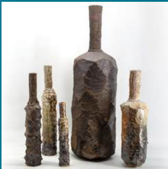
Sculpture, grès, porcelaine, cuisson Anagama

24300 Abjat-sur-Bandiât 06 83 61 30 47 tristangama@hotmail.fr www.tristanchambaudheraud.com @tristanchambaudheraud