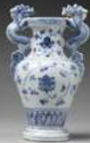
Vase à anses à décor floral Porcelaine, Bleu et blanc à décor en relief, Chine, Jiangxi, Jingdezhen, Dynastie Ming XV e siècle (milieu)

L'Europe adopte ce style dès le XVI e siècle, d'abord avec la faïence à glaçure stannifère (Delft, Nevers, Rouen, Moustiers), puis avec la porcelaine dure mise au point au début du XVIII e siècle à Meissen et développée à Sèvres. Le cobalt, extrait de gisements européens, demeure le principal pigment bleu. Cette couleur garde une forte valeur symbolique, liée à la noblesse, à la pureté et à la maîtrise technique.