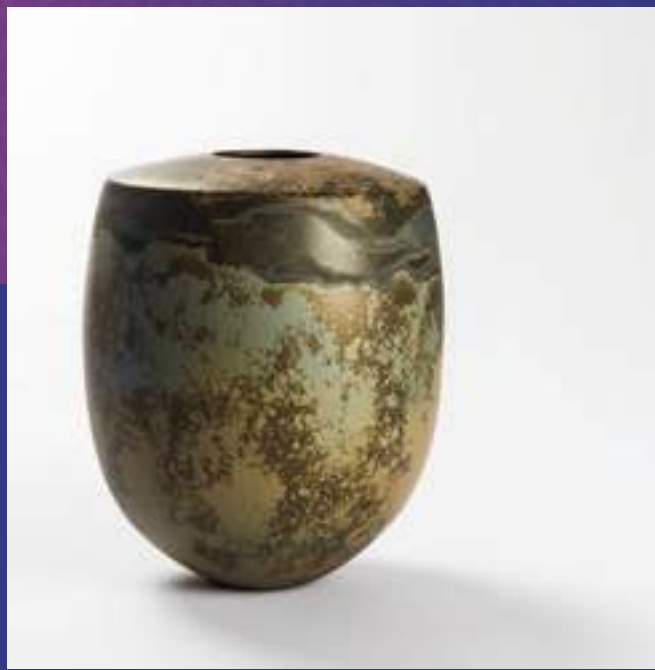
Arts décoratifs, Sigillée

24340 La Rochebeaucourt 06 63 35 45 07 loic.gainard@yahoo.com /// @loicgainardceramics