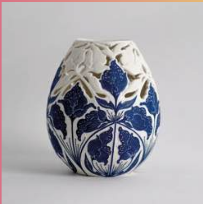
Utilitaire, Arts décoratifs, Porcelaine sgraffiée

81300 Graulhet 06 81 33 44 41 lea.zanotti@gmail.com www.leazanotti.com @leazanotticeramique