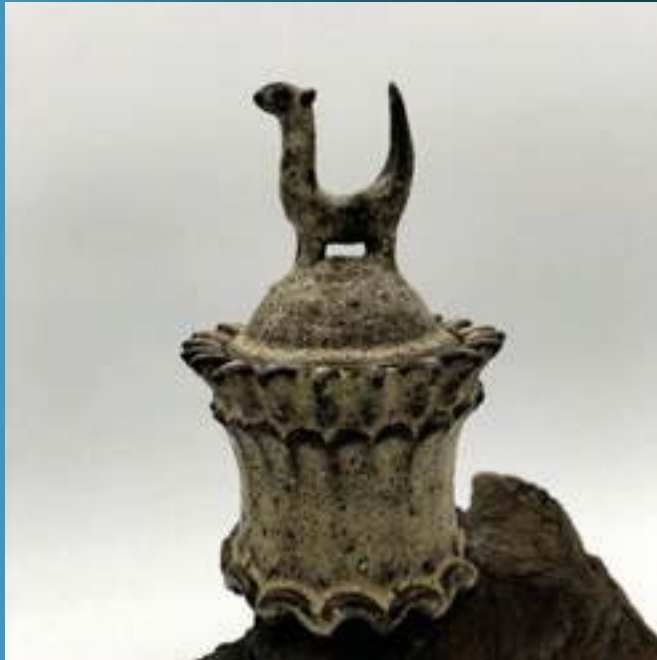
Utilitaire, Arts décoratifs, Terres de collecte