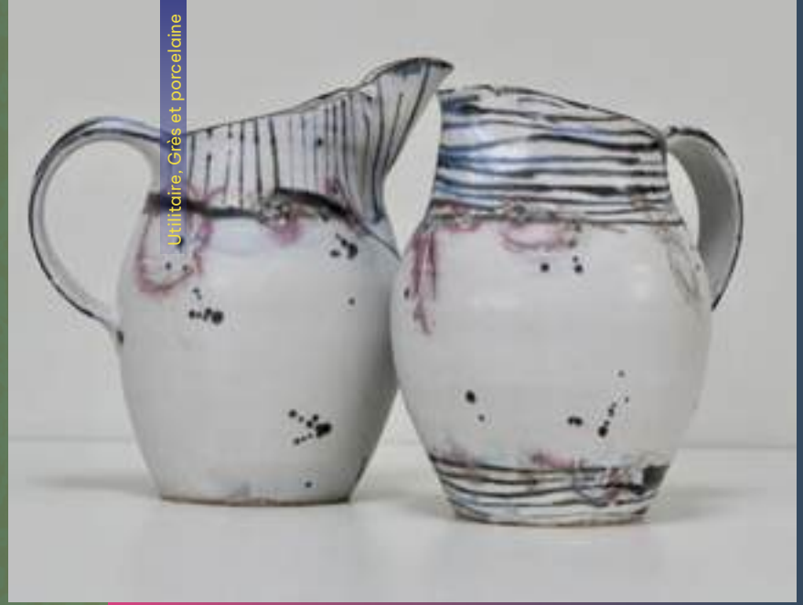
Utilitaire, Grès et porcelaine

71260 Péronne 06 08 49 37 50 corinnebetton@yahoo.fr /// ///