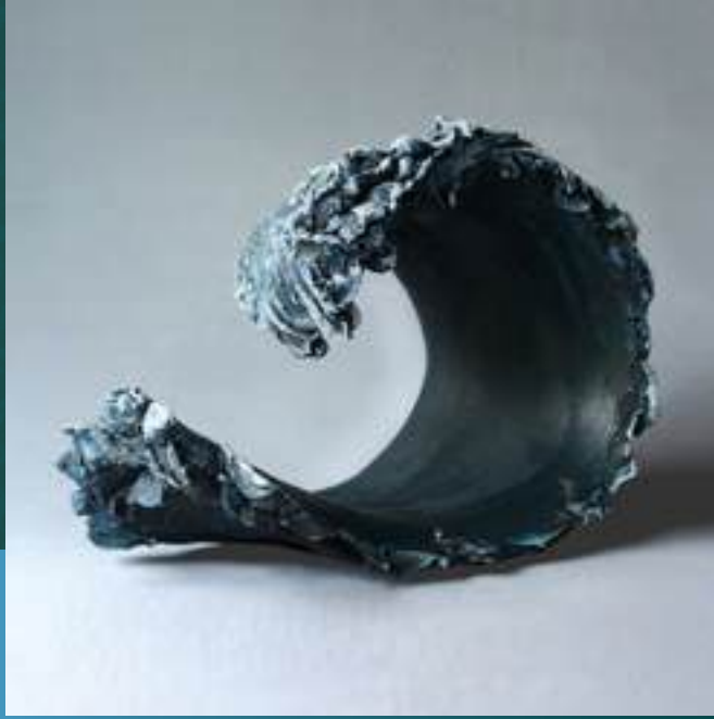
Utilitaire, Sculpture, Grès