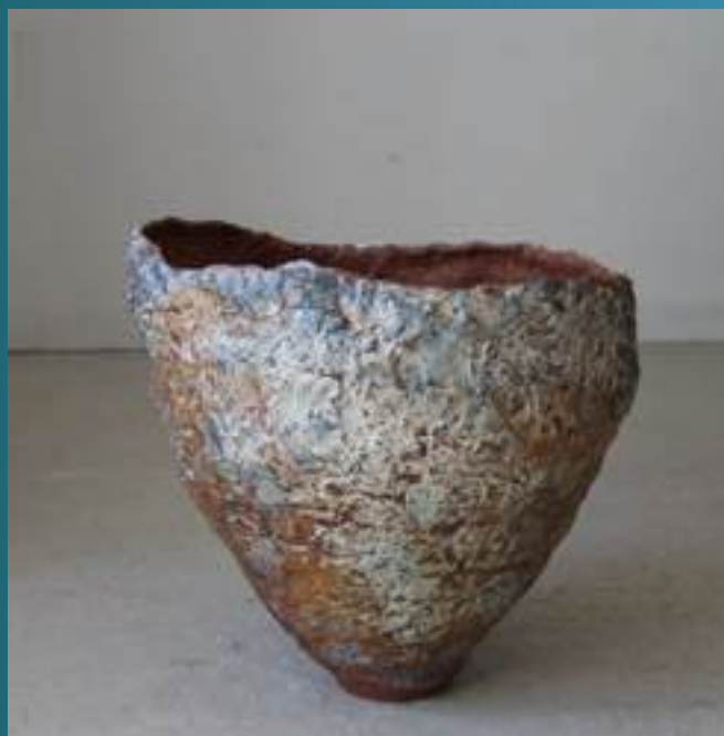
Utilitaire, grès réduction monocuisson

26160 Pont-de-Barret 06 27 69 15 13 juliegilles@live.fr www.juliegilles.wixsite.com/ceramique @juliegillesceramique