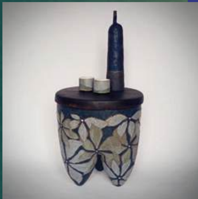
Sculpture, Arts décoratifs, Modelage grès

24300 Abjat sur Bandiat 06 20 66 80 61 lepape.claire@yahoo.fr /// @clairlepepaceramiste