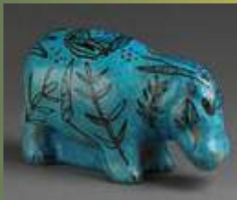
Figurine d'hippopotame Dra Aboul el-Nag, Égypte, -1875 / -1680

Les premières céramiques bleues apparaissent entre 2500 et 2000 avant notre ère, en Égypte et en Mésopotamie. En Égypte, se développe une faïence siliceuse qui s'auto-émaïlle à la cuisson. La couleur bleue est obtenue grâce au cuivre, donnant des tons turquoise qui rappellent l'eau du Nil et le ciel, symboles de vie et de renaissance. Les objets produits sont de petite taille : perles, amulettes, scarabées, figurines religieuses et petits vases.