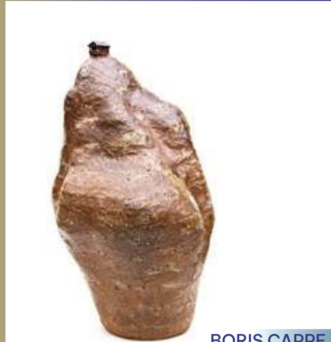
Sculpture, Grès, Porcelaine