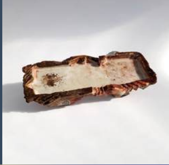
Arts décoratifs, Grès, Cuisson Anagama