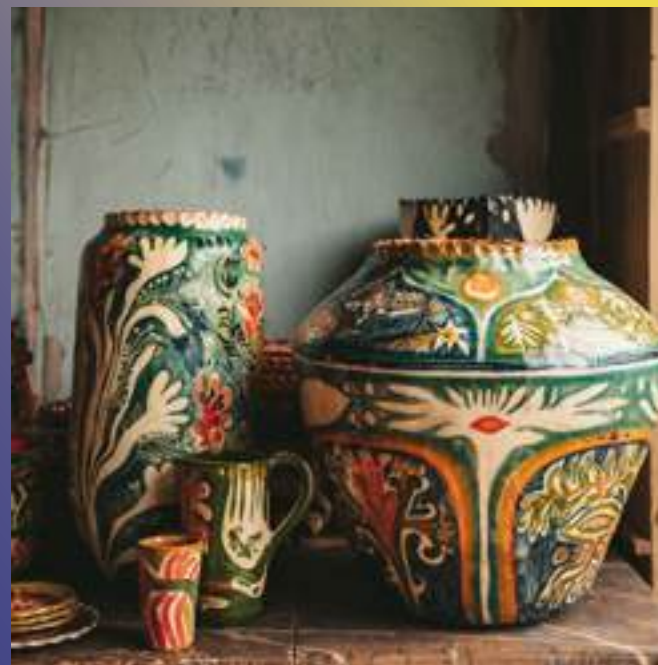
Utilitaire, Terre Vernissée

80210 Mons-boubert 06 87 45 12 49 l.defente@gmail.com /// @louisedefente