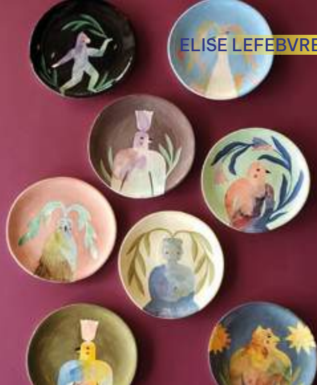
Utilitaire, Sculpture, Faïence et décor aux engobes

87100 Limoges 06 85 06 66 94 elise@elise-ceramique.com www.eliseceramique.bigcartel.com @eliseceramique