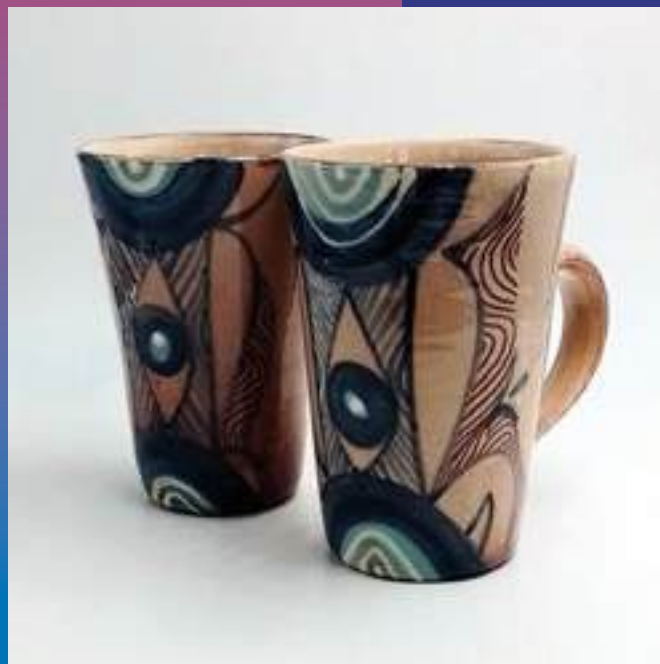
Utilitaire, Terres Vernissées

24270 Payzac 06 34 55 03 58 kiefier.judith8@gmail.com /// @kiefier.ceramique