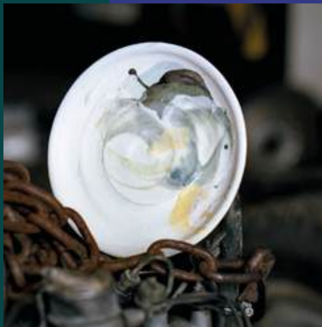
Utilitaire, Porcelaine et grès décorés