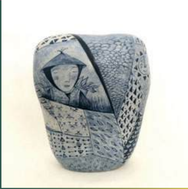
Sculpture, Arts décoratifs, Grès

17100 La Bisbal d'Empordà 00 34 65 43 3180 2 lur.ceramicoilustrada@gmail.com /// @lur.keramik