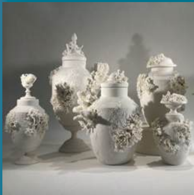
Utilitaire, Sculpture, Porcelaine

31000 Toulouse 06 81 66 44 33 xaviercastro.xacas@gmail.com /// @xavier.castro.studio