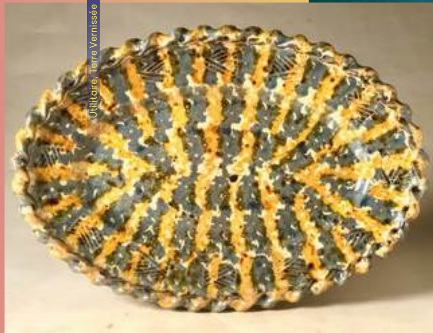
Utilitaire, Terre Vernissée

56220 Peillac 06 10 34 76 09 seanpots@btinternet.com /// @poterie_de_peillac