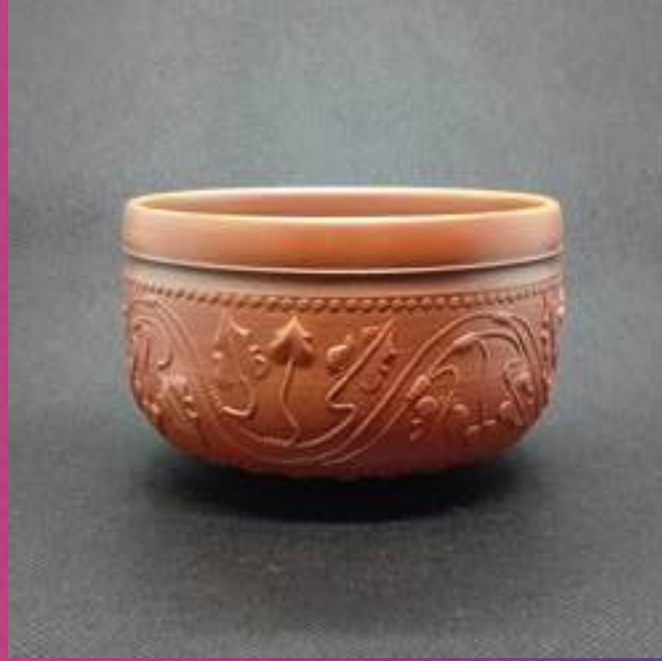
Utilitaire, Arts décoratifs, Sigillée