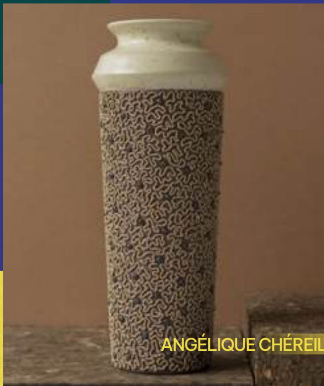
Utilitaire, Arts décoratifs, Grès décoré, Email

50800 Villedieu-les-Poêles 06 59 44 72 04 angeliquehereil@gmail.com www.angeliquehereilceramiques.fr @angeliquehereil