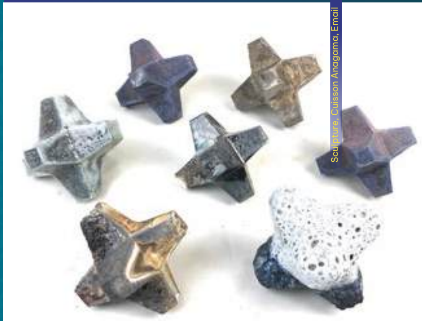
Sculpture, Cuisson Anagama, Email

43800 Vorey 06 48 13 43 32 rob.roy@laposte.net @robroyceramique 67000 Strasbourg 06 17 13 63 03 yunjungyiya@gmail.com @la_yun_jung