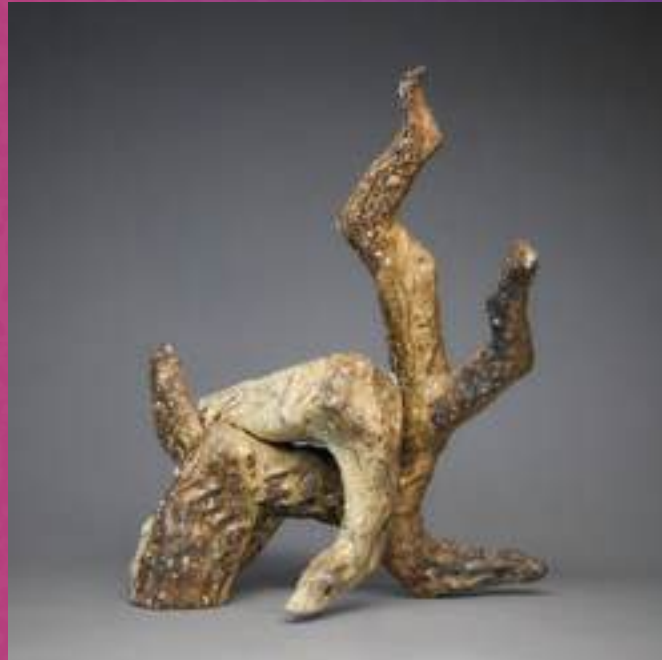
Sculpture, Grès, Cuisson Anagama

24300 Abjat-sur-Bandiât 06 14 26 19 13 maellecaborderie@gmail.com www.maellecaborderie.fr @maellecaborderie