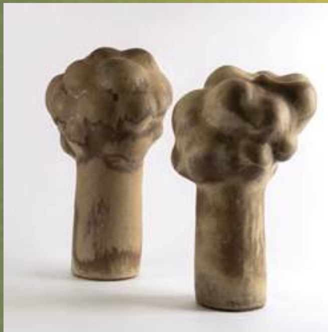
Utilitaire, porcelaine tournée

87500 Couzac Bonneval 06 74 67 73 02 marionleysseceramique@gmail.com www.marionleysseceramique.com @marion_Leyssene_ceramique