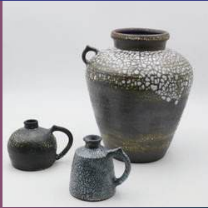
Utilitaire, Arts décoratifs, Grès, Email

71250 Buffières 06 72 21 89 84 quentin.baumlin@gmail.com /// @quentin.baumlin