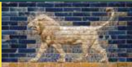
Lion - porte d'Ishtar Briques de pâte argileuse moulées en bas-relief et glaçure polychrome, porte d'Ishtar, Babylone, Mésopotamie, 580 avant J.-C

En Mésopotamie, les glaçures colorées sont utilisées très tôt, parfois avec du cobalt, surtout dans l'architecture. Au VI e siècle avant notre ère, cet art atteint son apogée avec les briques glaçurées de Babylone, comme la porte d'Ishtar. Les artisans y créent un bleu profond grâce à des mélanges de cuivre et de cobalt appliqués sur des briques cuites. Le bleu devient alors une couleur prestigieuse, liée au pouvoir et au sacré.