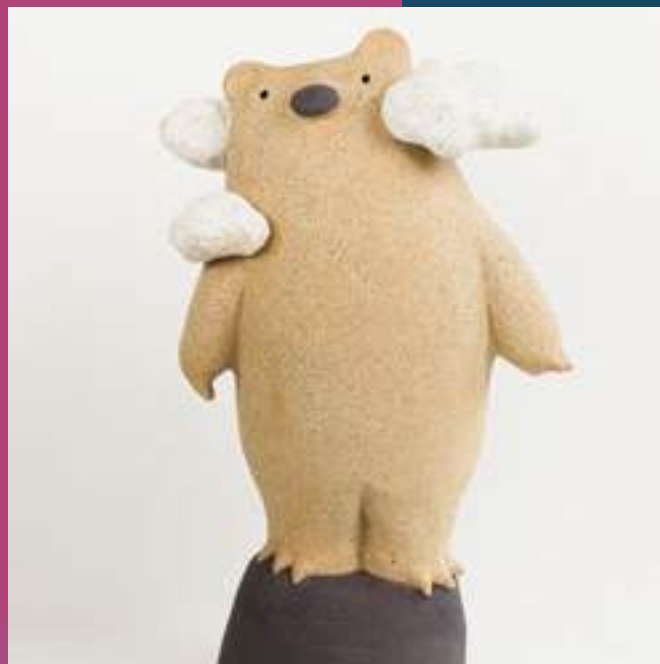
Sculpture, Colombin essentiellement

67540 Ostwald 06 28 25 76 84 contact@echarlotte.fr www.charlotteheurtier.fr @charlotteheurtierceramique