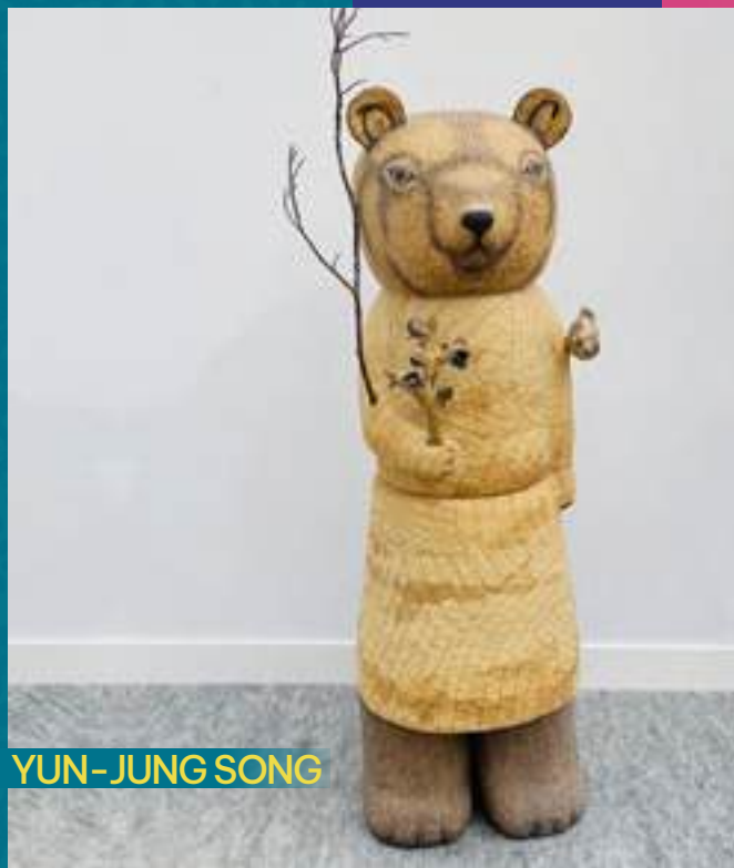
Utilitaire, Sculpture, Grès, Porcelaine