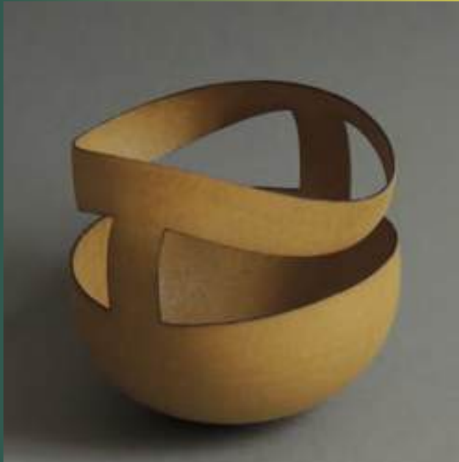
Utilitaire, Sculpture, Grès