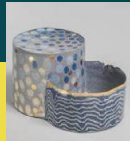
Bassin - Stéphanie Bertholon

De son côté, Stéphanie Bertholon explore la porcelaine à travers un imaginaire nourri de nature et d'Extrême-Orient. Bols aux décors ponctués d'émaux en ocelles, bassins en suspension aux glaçures douces et superposées, vases-boules constellés de taches rehaussées d'or : chez elle, le bleu dialogue avec les gris satinés et les ors mats, évoquant plumages, coquillages ou eaux calmes. Il ne se limite pas à une référence historique, mais devient atmosphère, vibration, paysage.