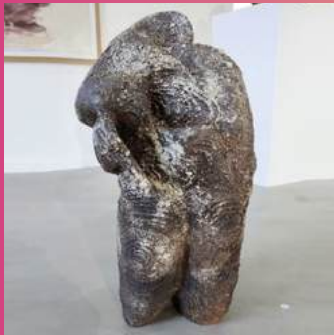
Sculpture, Grès, Cuisson Bois

89130 Fontaines 07 66 07 99 49 virgile@hotmail.fr /// @virgileloyer