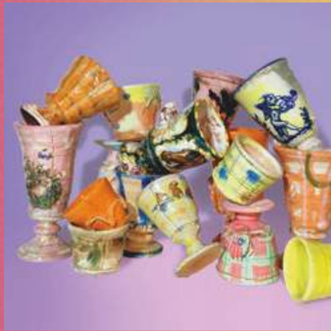
Utilitaire, Arts décoratifs, Terre vernissée

26160 Bonlieu-Sur-Roubion 06 95 53 14 72 alphonse.papillons@gmail.com /// @nids_a_poussiere