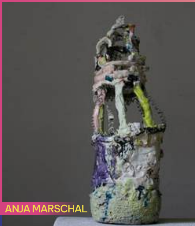
Sculpture, Porcelaine, Grès, terre vernissée