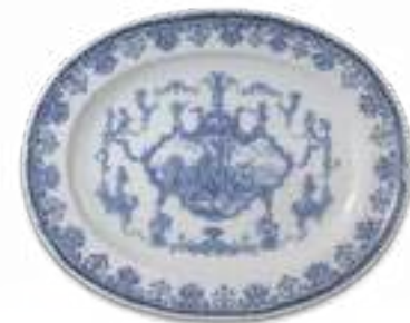
Grand plat de Moustiers, Orphée charmant les animaux Plat d'apparat, Faïence stannifère, décor aux oxydes métalliques de grand feu, 1720-1730

Au XIX e siècle, l'industrialisation généralise le bleu : impression par transfert, émaux standardisés et cobalt raffiné permettent une production massive de vaisselle et de carreaux. Jadis luxueux, le bleu quitte progressivement le domaine du luxe pour entrer dans celui du quotidien. Dans la céramique contemporaine, il demeure pourtant une couleur d'exigence et de recherche. Les artistes l'emploient autant pour ses qualités plastiques que pour la charge culturelle qu'il véhicule. Utilisé sur faïence, grès ou porcelaine, en émaux mats, brillants, cristallisés ou superposés, il devient parfois citation du bleu et blanc historique, parfois terrain d'expérimentation formelle.