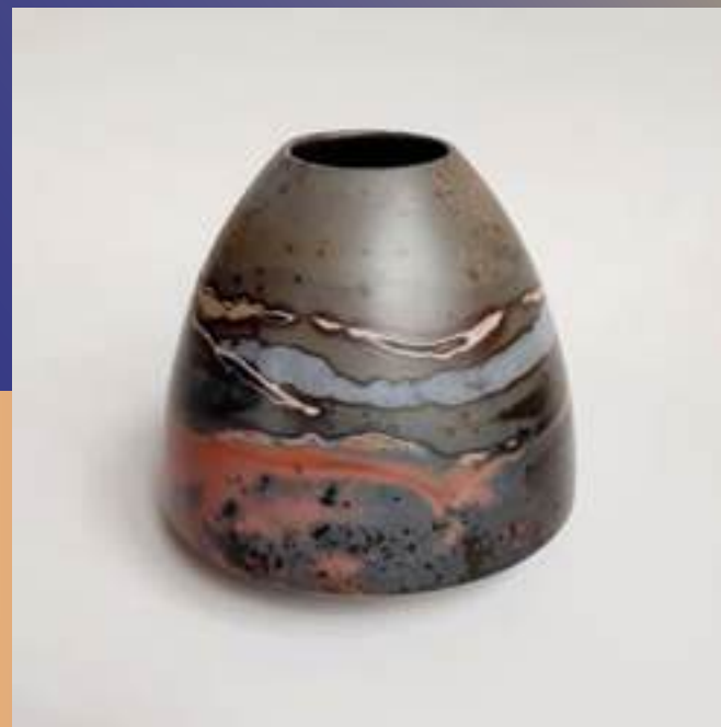
Arts décoratifs, Sigillée

80210 Mons-boubert 06 87 45 12 49 l.defente@gmail.com /// @louisedefente